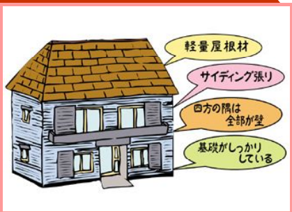
松下電工トータル外装提案カワグ

震度7の激震にも生き残った住宅があります。その共通点は、(1)屋根が新生瓦や瓦棒など、建物に対する荷重負担が少ない軽量屋根材が多い。(2)壁も軽量で内部の通気性がよいサイディング貼りが多かった。(3)窓などの開口部が少なく、壁の量が多く、四方の隅は全部が壁になっている。(4)基礎がしっかりしていて、建物と一体となっていた。つまり、建築基準法の新耐震設計基準を守って設計・施工された木造住宅は激震にも耐えるというわけです。