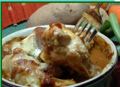
日本ピュアフード株式会社